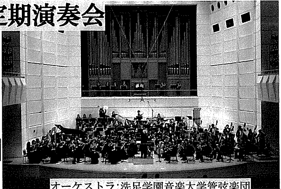
オーケストラ：洗足学園音楽大学管弦楽団