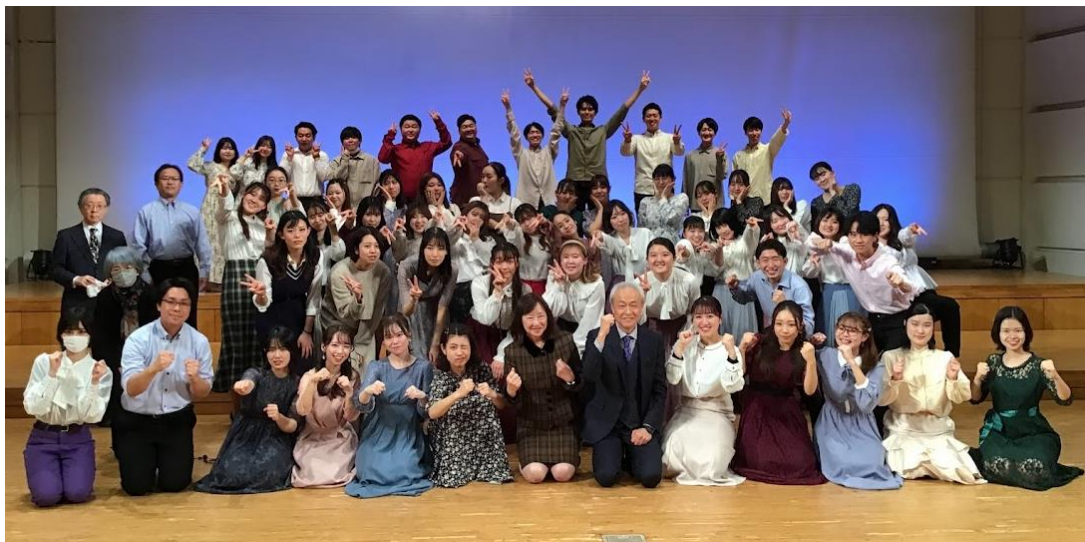
▲2022年12月10日開催「第18回音楽教育コース定期演奏会」より